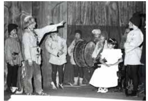
In 1982 voerden de leerlingen van Roesbrugge ter gelegenheid van het ouderfeest 'Katina's droom' op. Auteur Romain Depuydt regisseerde en de foto toont een moment uit de opvoering.

moment vermoeden dat die relatief onbekende 'chips' van toen in de jaren die volgden en nu nog altijd onze wereld in een gigantische versnelling zouden jagen. En het lijkt er sterk naar uit dat die chips ons in de toekomst nog meer gaan verbazen.