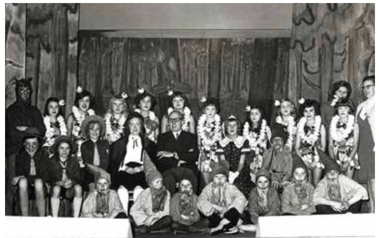
In december 1972 bracht de meisjesschool van Roesbrugge op het grote podium van De Gouden Arend 'De schat van de Rotsenburcht', een sprookje van Romain Depuydt. Op de foto jonge uitvoerders, samen met auteur-regisseur Depuydt en de leerkrachten en zusters van de school.