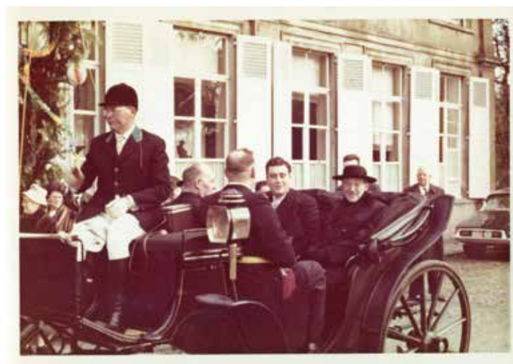
November 1960, inhuldiging als nieuwe burgemeester van Proven.

Momenteel beschikt Poperinge nog altijd niet over een CC.