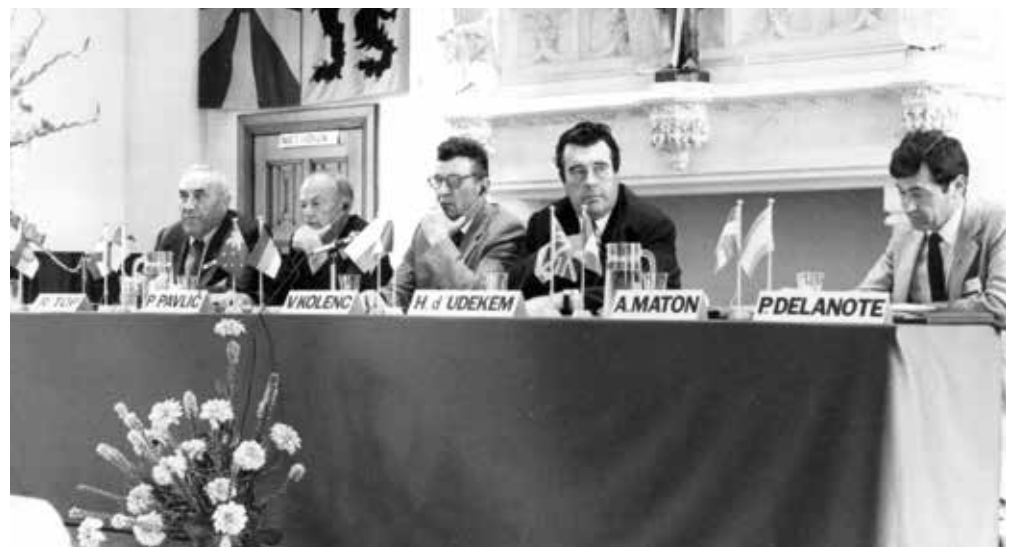
Augustus 1982: internationaal hoppecongres te Poperinge