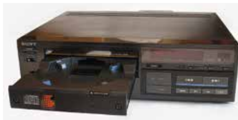
De allereerste CD-speler van Sony, in november 1981, een technisch wonder.

- Eind 1981 lanceerde Sony trots de allereerste CD-speler. Het nieuws werd aangekondigd als een immense innovatie die de vinylplaten definitief naar de vuilnisbak zou verwijzen. Er opende zich een zee aan mogelijkheden. Want al snel kwamen er na de muziek-cd's ook beschrijfbaar exemplaren die de bandopnemers en de cassettepelers overbodig maakten en later werd de CD het medium om computerbestanden op te bewaren. Wonderlijk allemaal, maar ondertussen ook al voorbijgestreefd. Tegenwoordig doen we het met USB-sticks, Spotify en 'in the cloud'. En wie echt 'hot' wil zijn, koopt zich... een platen-speler. Vreemde wereld toch!