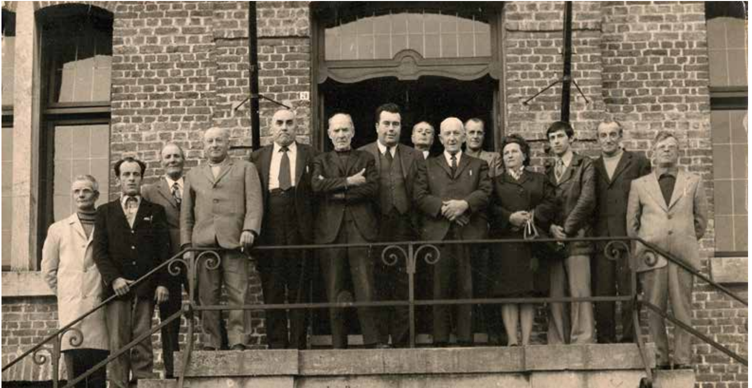
Fusie van de gemeenten Proven en Krombeke. De gemeenteraadsleden na de eerste gezamenlijke gemeenteraad op de trappen van het gemeentehuis in Proven.

oordeling omwille van belangenvermenging voor de rechtbank, heeft zijn carrière in mineur doen eindigen. Het is eigenlijk onwaarschijnlijk dat een politicus die een halve eeuw actief was op zo'n triestige manier zijn toevlucht moest nemen tot een smadelijke vlucht. Na de nederlaag van 1982, was dit waarschijnlijk de meest bittere pil.