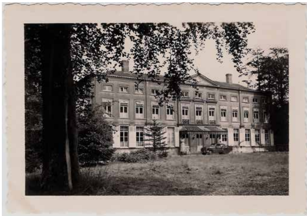
Kasteel 't Couthof in 1958. Het werd gebouwd in 1743 als eigendom van de familie Mazeman. Tussen 1865 en 1875 werd het kasteel verbouwd en het park aangelegd naar Engels model.