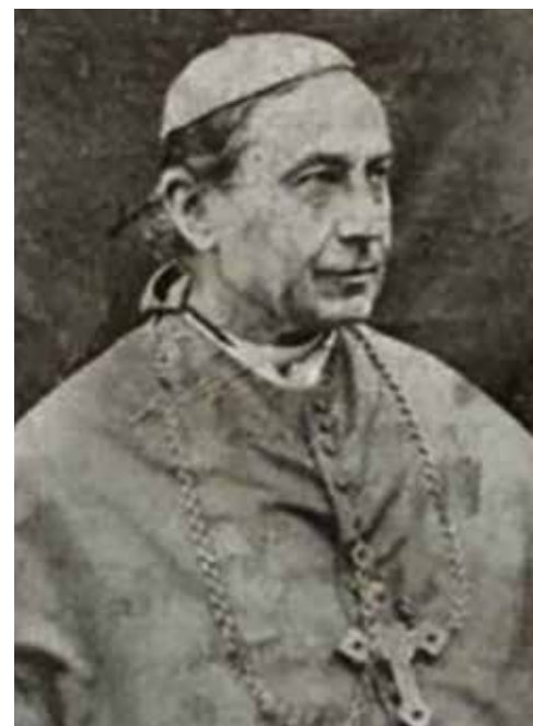
Gustave Waffelaert bisschop van Brugge van 1895 tot 1931

* Tot 1910 was de leeftijd voor de eerste communie 11 à 12 jaar. Daarna op 7 jaar, plechtige communie en vormsel op 12 jaar ** Had de bisschop er toen niet op aangedrongen dan had dit dagboek nooit bestaan!