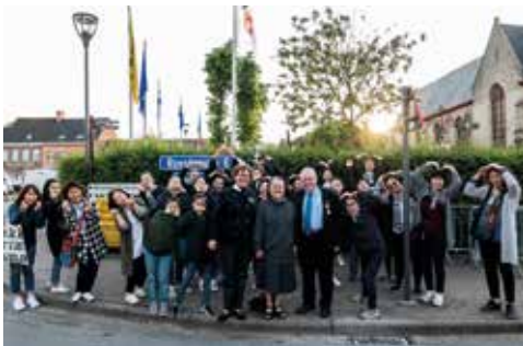
2018: Pueri Cantores uit Daegu (Z.-Korea)

Alle medewerkers aan het festival voelden zich erkend in hun verdiensten met de titel "Ambassadeur van Poperinge" die in april 2019 werd toegekend.