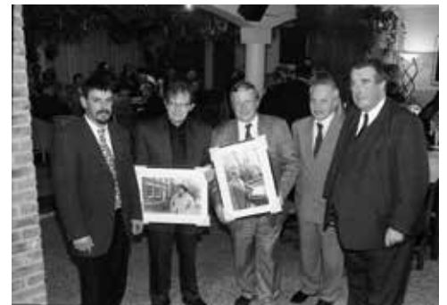
1996: Poëziezomers en Gregoriaans Festival: Culturele ambassadeurs van Vlaanderen

De kloosterregel van de heilige Augustinus "Laat de woorden die u zingt ook leven in uw hart" waren voor jou geen opgave. De regel be-