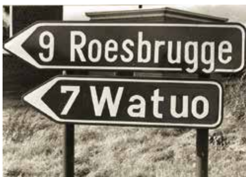
Nieuwe wegwijzers in 1981: geen grap, gewoon een 'foutje'.

Aan het einde van de vijftiger jaren leek de TBC ingedijkt en in 1960 kwam een delegatie van de Broeders van Dale – met moederhuis in Kortrijk – in De Lovie een woonpark voor mensen met een verstandelijke beperking opzetten.