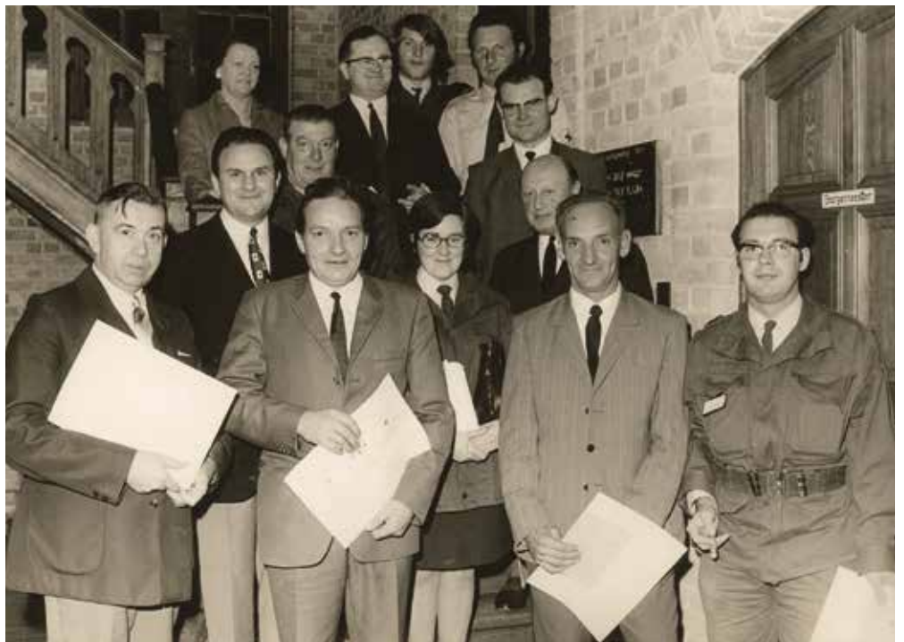
Een deel van de gediplomeerde ambulanciers met het bestuur van de plaatselijke Rode Kruisafdeling