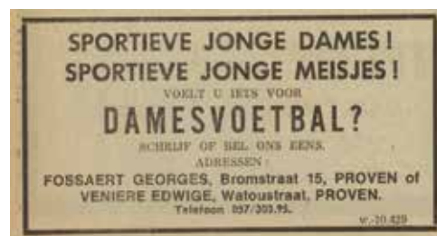
Proven hoopte met een krantenadvertentie speelsters te vinden voor een damesvoetbalploeg. Ervaring was blijkbaar niet vereist.

ten. De Poperingse volleybalclub Povo speelde er memorabele wedstrijden op het hoogste niveau en zowat alle grote namen uit de Vlaamse showbizz van toen stonden er ooit op het podium. Leon Vandewalle verdiende in 1981 dan ook een grote uitzwaai, maar dat wilde hij niet.