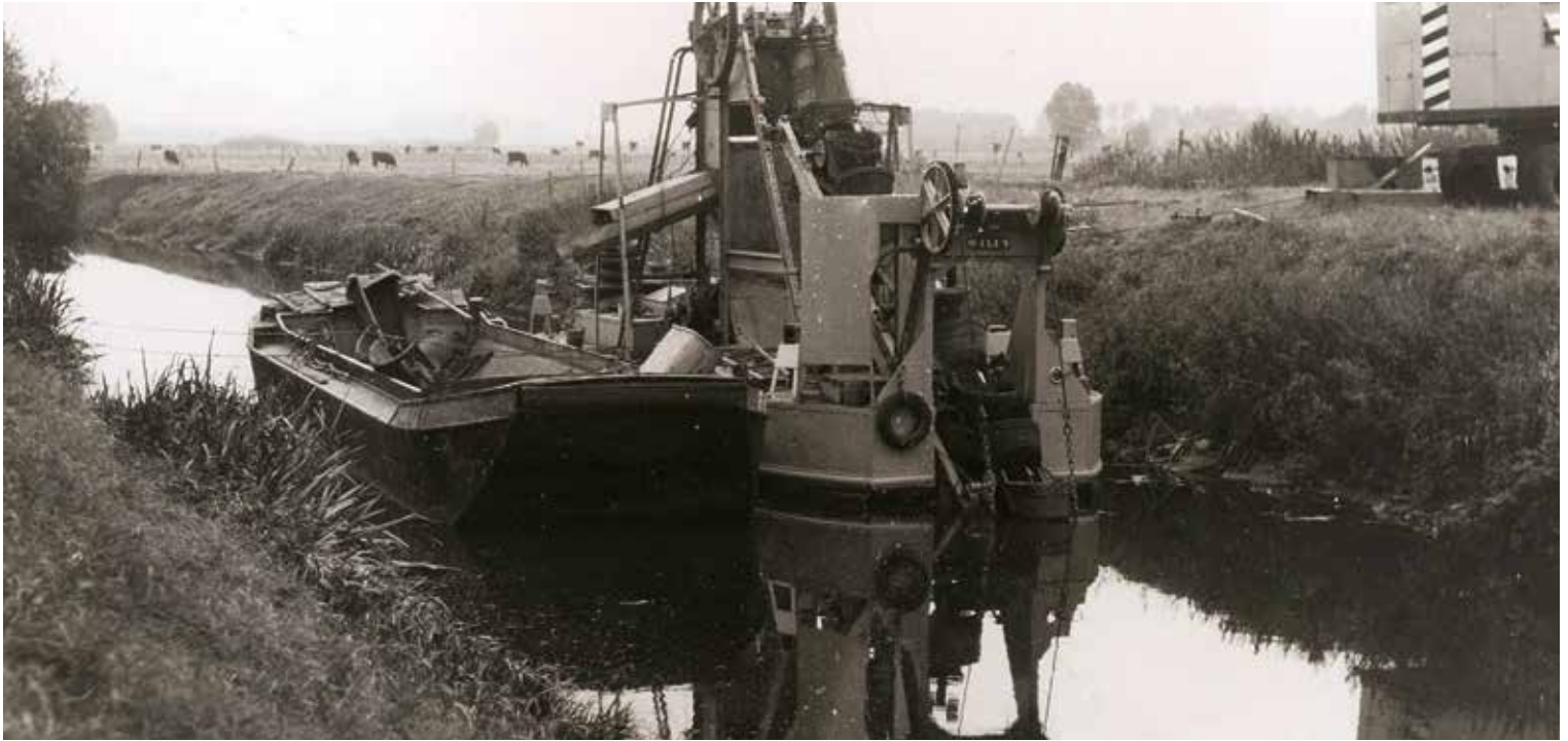
Een beeld van de baggerwerken in de IJzer in 1971

Delalleau werd als medestichter en 50 jaar bestuurslid van de Samenwerkende Brandverzekeringsmaatschappij van Watou gelauwerd met de Gouden Palmen der Kroonorde en het ereteken eerste klasse van de Arbeid.