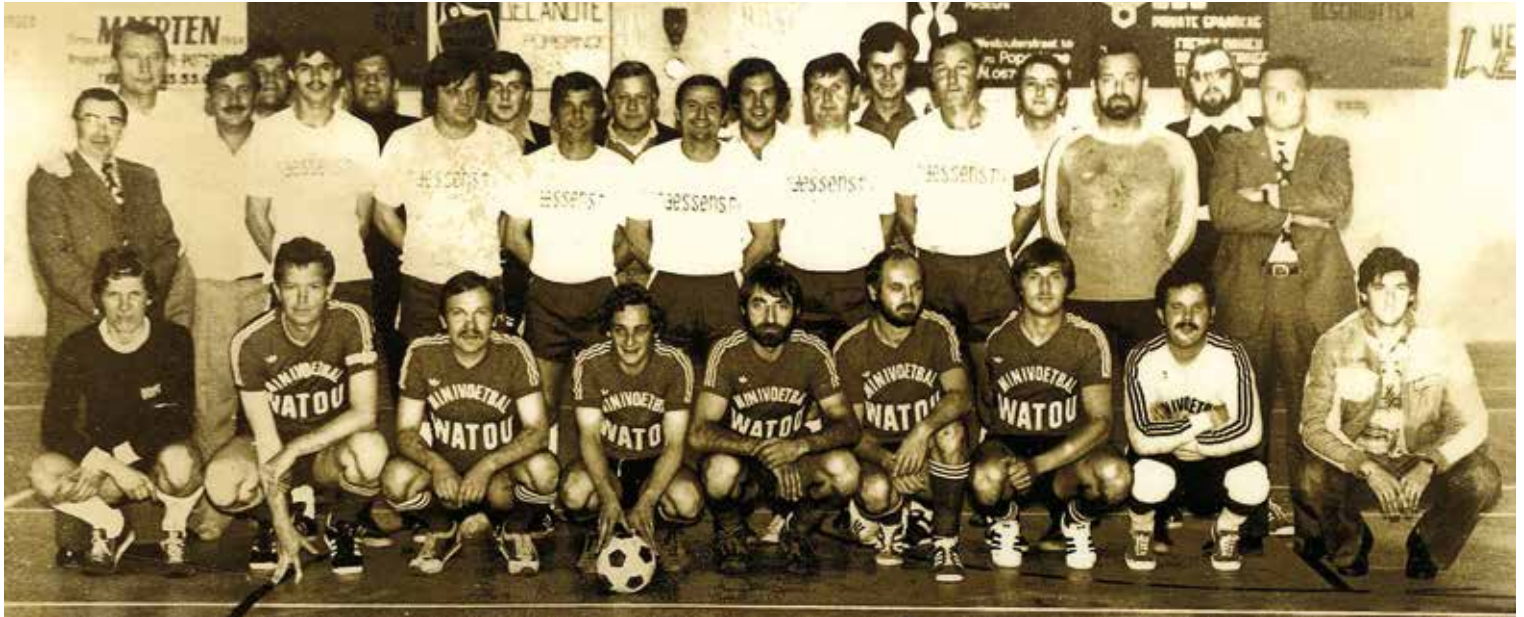
De minivoetbalcompetitie startte in 1981 met een treffen tussen Studax en Watou. De spannende match eindigde op een gelijkspel.

Zijn verdiensten als schrijver-dichter vertaalden zich toen al in verschillende literaire prijzen. De dichtbundel werd uitgegeven door Lannoo en kreeg heel wat lovende recensies.