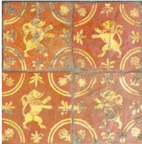
Leeuwtegel met dubbele kwartcirkel met in elke hoek een bloemtakje.

Het was met de onafhankelijkheid van België in 1830 en waarschijnlijk onder invloed van zijn schoonvader Louis Benedictus Van Renynghe (4), dat het bedrijf D'acquet weer begon met het