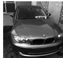
BMW 116 d