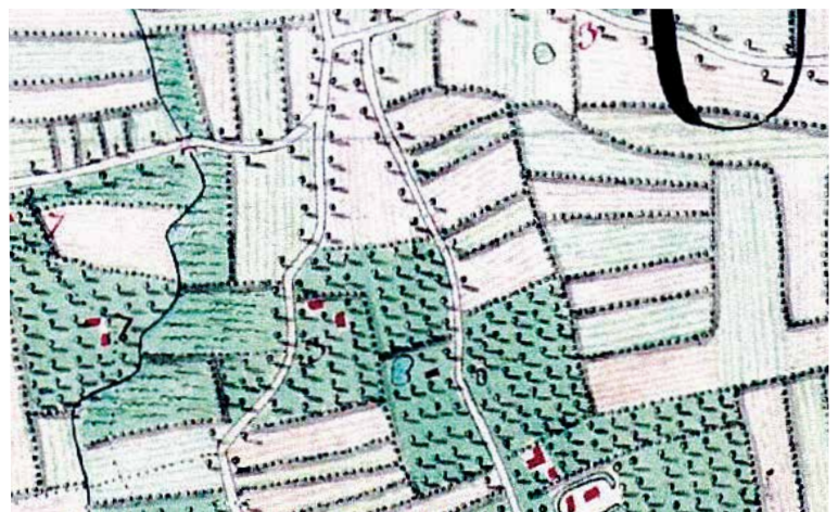
In opdracht van keizerin Maria-Thérèsia van Oostenrijk werd tijdens haar bewind voor gans het land door J. J. F. graaf de Ferraris een stafkaart opgemaakt in de jaren 1771-1778. Deze kaarten worden de kabinetkaarten van Ferraris genoemd.