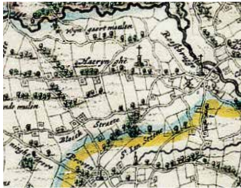
De kaart van de Kasselrij van Veurne uit "Atlas Major"

Dit mag niet uitgelegd worden in de zin van een huiskapel van een kasteelheer en zou gediend hebben voor zijn familie en huispersoneel. Neen, zij lag er te ver van af, ongeveer anderhalve kilometer van Proven en drie kilometer van Krombeke.