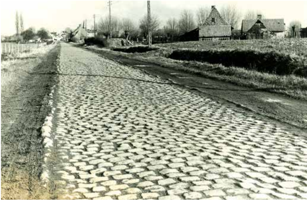
De weg Proven-Krombeke in 1972, kort voor ze geasfalteerd werd. Wie er geregeld passeerde, juichte die ingreep ongetwijfeld toe, maar die oude kasseien doen wielerfanaten nu misschien wel dagdromen.