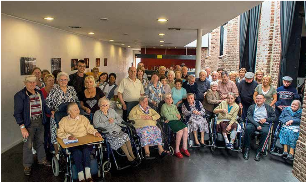
Afscheid van de bewoners in de parochiezaal, 2008