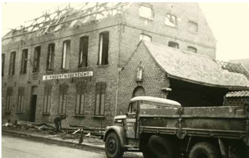
Afbraak oud rusthuis 1962

De onderhoudsprijs bedroeg in 1970 100 fr. voor Watounaars op een kamer en 90 fr. op de zaal. 'Vreemdelingen' betaalden 10 fr. meer. De weddes voor het personeel bedroegen gemiddeld 40 fr. per uur.