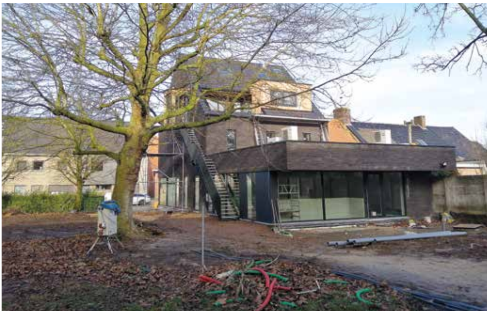
de Belle (begin 2022)