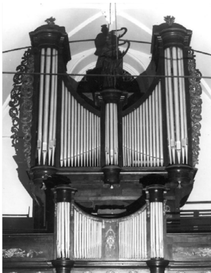
Anneesensorgel (circa 1960)

December 1910: De kerkfabriek koopt een nieuw wit missegewaad, om te dienen in de grote plechtigheden. 't Is gemaakt van wit satijn, met gouden borduursels omzet en versierd. 't Huis geleverd, 't kost 2002 fr. Wij gebruiken het zelve de eerste keer op de hoogdag van kerstdag 1910.