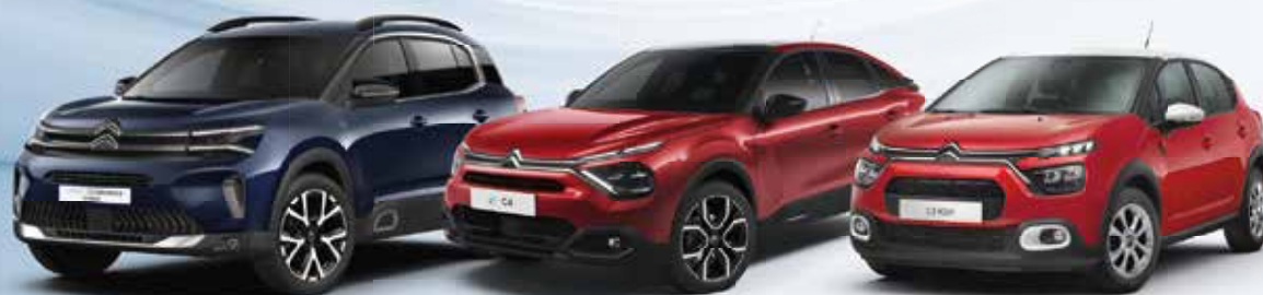
NEW C5 AIRCROSS SUV PLUG-IN HYBRID