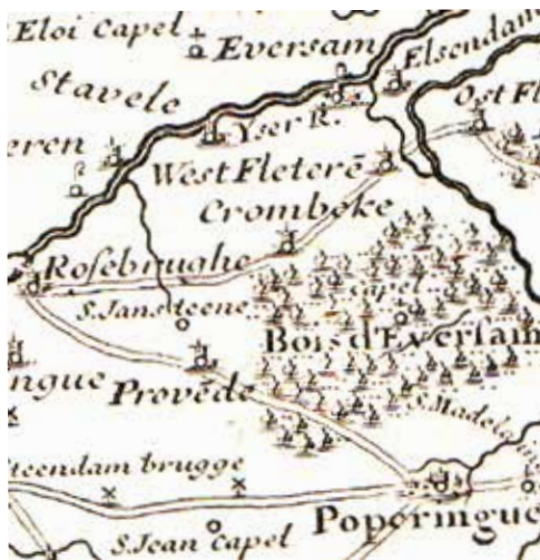
Carte du Comté de Flandre - MDCCIII.

Historisch belangrijk voor Krombeke en op veel kaarten vind je de Sint-Jans Steenekapel terug. De Sint-Jans Steenekapel was niet zomaar een kapel, het moet een grote kapel (kerkje) geweest zijn. Hoe en wanneer de Sint-Janssteenekapel is ontstaan, zal wellicht voor altijd een mysterie blijven. Was het een gewone kapel geweest, stond ze niet afgebeeld op meerdere historische kaarten. Men zou echter een zeer grote vergissing begaan met haar te vergelijken met een hedendaags devotiekapelletje met een paar heiligenbeelden, waarschijnlijk van St.-Jan de Doper 1 en waar er amper ruimte genoeg was voor het plaatsen van een aantal stoelen of banken.