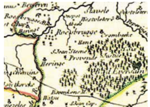
Uit "Atlas Universelle", Paris 1750-1757

Het geslacht van Stavele, opgevolgd door het geslacht van Hoorne, was door deze bezittingen in de parochie onbetwistbaar de leidende familie. Krombeke was net als Beveren een direct leen en