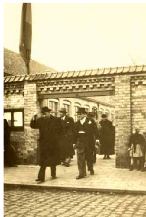
Minister Detaeye verlaat met burgemeester Vandenameele het toenmalige gemeentehuis in de Poperingestraat (Douvieweg)

toegewezen en in oktober 1950 werden de werken aan de bouw van het mannenkwartier en infirmierie eindelijk aangevat. Nu de nieuwe vleugel van het rusthuis eindelijk realiteit werd, was het moment aangebroken voor de officiële inhuldiging van de gedenksteen. Minister van volksgezondheid Alfred Detaeye werd bij zijn bezoek op 27 januari 1951 met alle egards ontvangen. Hij werd door de dorpsnotabelen te Sint-Jan-ter-Biezen opgewacht en naar de woning van burgemeester Germain Vandenameele in de Steenvoordestraat begeleid. Vandaaruit ging het in stoet naar het gemeentehuis (toen nog in een deel van de knechtenschool), onder begeleiding van het Sint-Ceciliamuziek, de schoolkinderen en de vaandels van alle verenigingen. Ze eindigden bij de nieuwbouw waar de minister de oude en nieuwe gebouwen bezocht en de gedenksteen onthulde. Net zoals bij het oorspronkelijke gebouw uit 1851 werd ook nu, volgens beschikbaarheid van de budgetten, gestaag verder gebouwd. In 1957 kwam er een keuken, een lift en een 'artesiaanse put'. Pas in 1962 was in de nieuwe gebouwen ruimte genoeg voor iedereen, zodat het oude gebouw