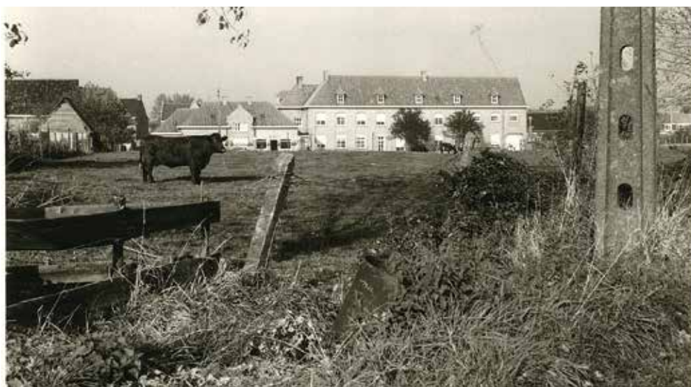
De weide van het rusthuis waar de Schutterswijk gebouwd werd.