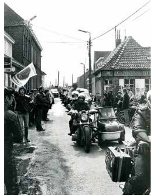
De passage in 1982 van een motorronddrit met personen met een beperking toont een stukje Sint-Jan-ter-Biezen dat ondertussen al lang verdwenen is.