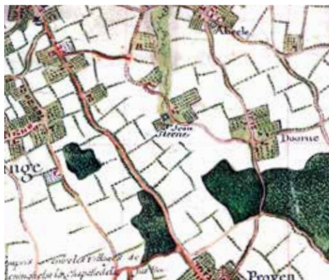
Masse kaarten (1729-1730)