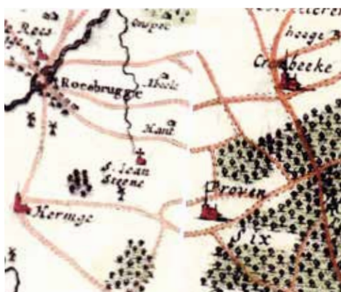
Fricx kaarten - 1712

Wanneer de St.-Jans Steenekapel in de St.-Jans Steenstraete (nu Bromstraat) op de St.-Jans Steenhoek te Krombeke tijdens de Beeldenstorm