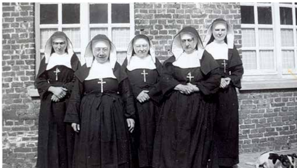
Zusters van het rusthuis in maart 1940

De eerste plannen om aan deze schrijnende toestand iets te doen dateren van einde jaren 1930. Ze zijn echter op totaal verouderde opvattingen gebaseerd. Het oude hoofdgebouw, toen al in bouwvallige staat, werd uit zuinigheid als vrouwenafdeling en klooster behouden. De mannen kregen een plaats in een westelijke nieuwbouw langs de straatkant, de gesloopte kapel werd vervangen door een nieuwe op de binnenkoer. De boerderij met paarden-, koeien- en varkensstallen bleef behouden, net als het hospitaaltje. De COO-raad zag het zo: "Zonder weide zou het fokken van dieren onmogelijk gemaakt worden ten nadele van al de oude lieden van 't gesticht die schier uitsluitend leven van de opbrengst der boerderij". Die plannen werden door de bestendige deputatie geweigerd en na de Tweede Wereldoorlog kreeg men gelukkig andere inzichten. Architect Gits uit Ieper ging uit van een modernere visie op de bouw van rusthuizen. De oude boerderij moest definitief plaats maken voor een nieuwbouw, het oude hoofdgebouw zou, na afloop van alle werken, gesloopt worden. Deze plannen werden wel goedgekeurd en Minister baron F.X. van der Straeten-Waillet zegde schriftelijk een subsidie van 1.000.000 fr. toe. In februari 1950 werden de werken aan Valère Pittellioen uit Boezinge