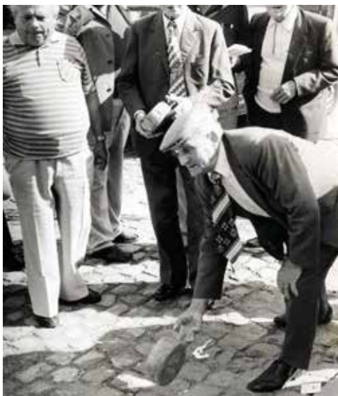
In Watou werd ter gelegenheid van de inhuldiging van het standbeeld van de brouwer op de Kleine Markt ook 'gestratebold', een sport die er nog altijd beoefend wordt.