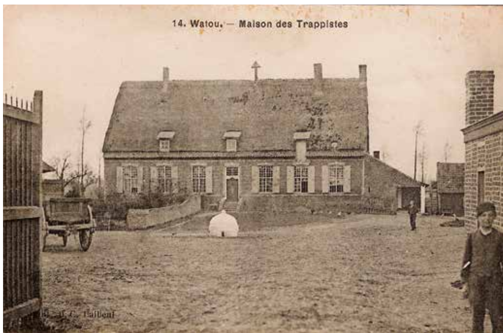
De refuge van de paters trappisten, gekend als de 'paterboerderij'-toestand circa 1905.