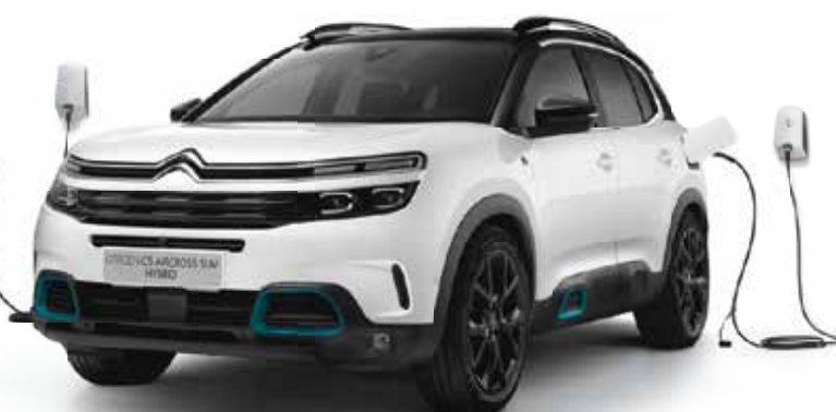
SUV CITROËN C5 AIRCROSS HYBRID