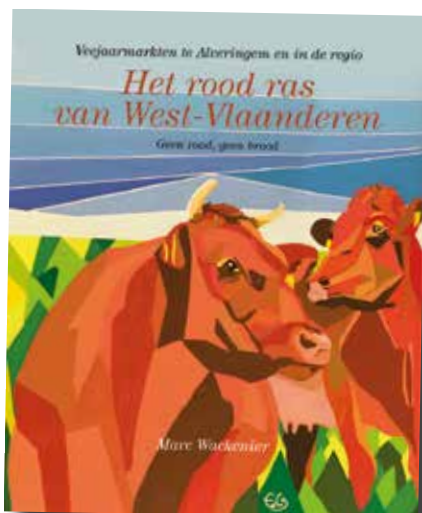
De gouache op de cover van stier en koe (geschilderd) is van het penseel van Els Deschrevel (Alveringem).

De publicatie is voorzien in het najaar van 2021, symbolisch de periode waarin jaarlijks het 'Beestenfeest' gehouden werd, met name op de derde donderdag van november.