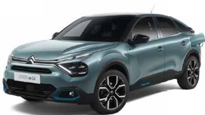
NEW CITROËN Ë-C4 100% ÉLECTRIC