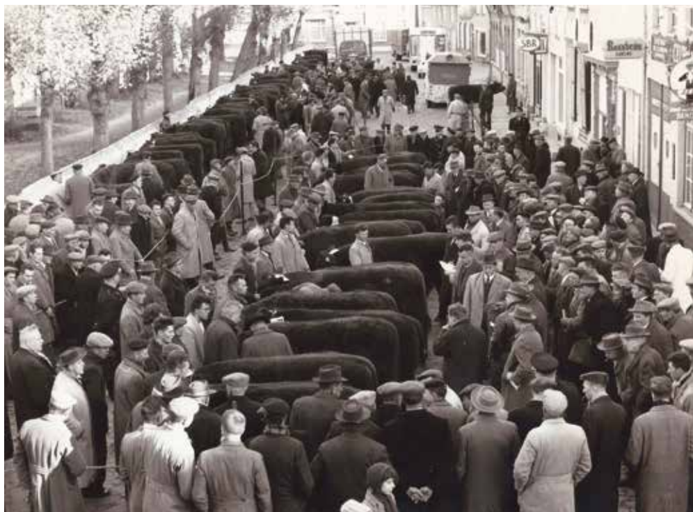
Provinciale jaarmarkt voor stamboekvee te Alveringem in 1962.

Er is veel origineel fotomateriaal verwerkt en de stamboeken van het rood ras (stieren en melkkoeien) werden grondig bestudeerd.