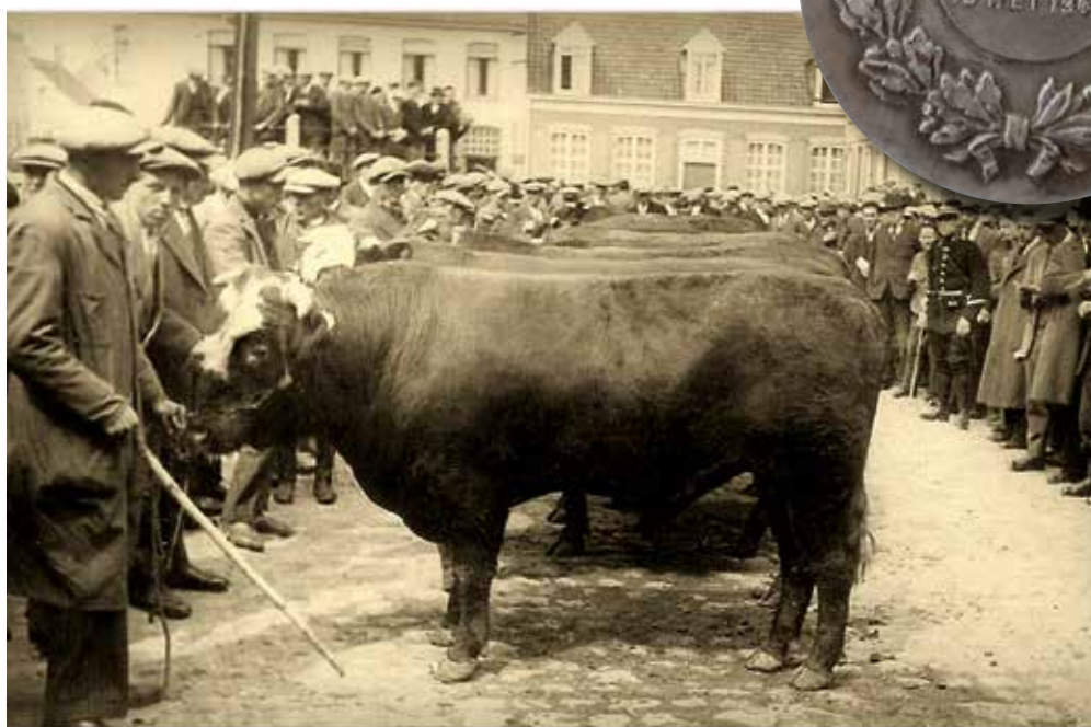
Veeprijskamp te Roesbrugge in 1935.