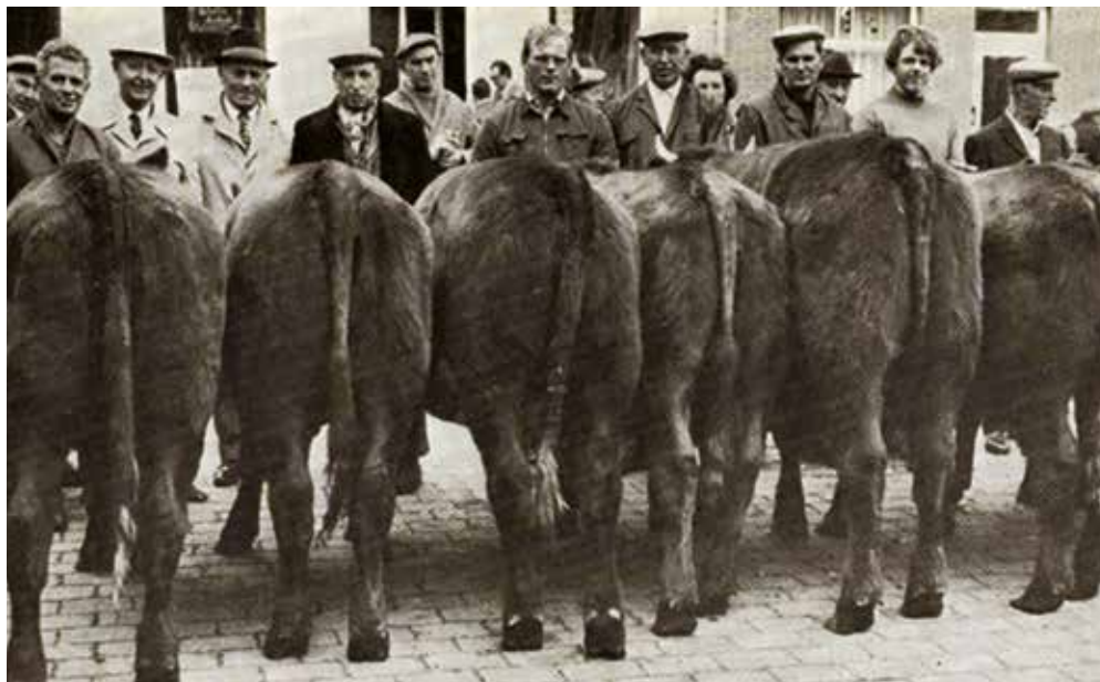
Veeprijskamp te Roesbrugge eind jaren 70.