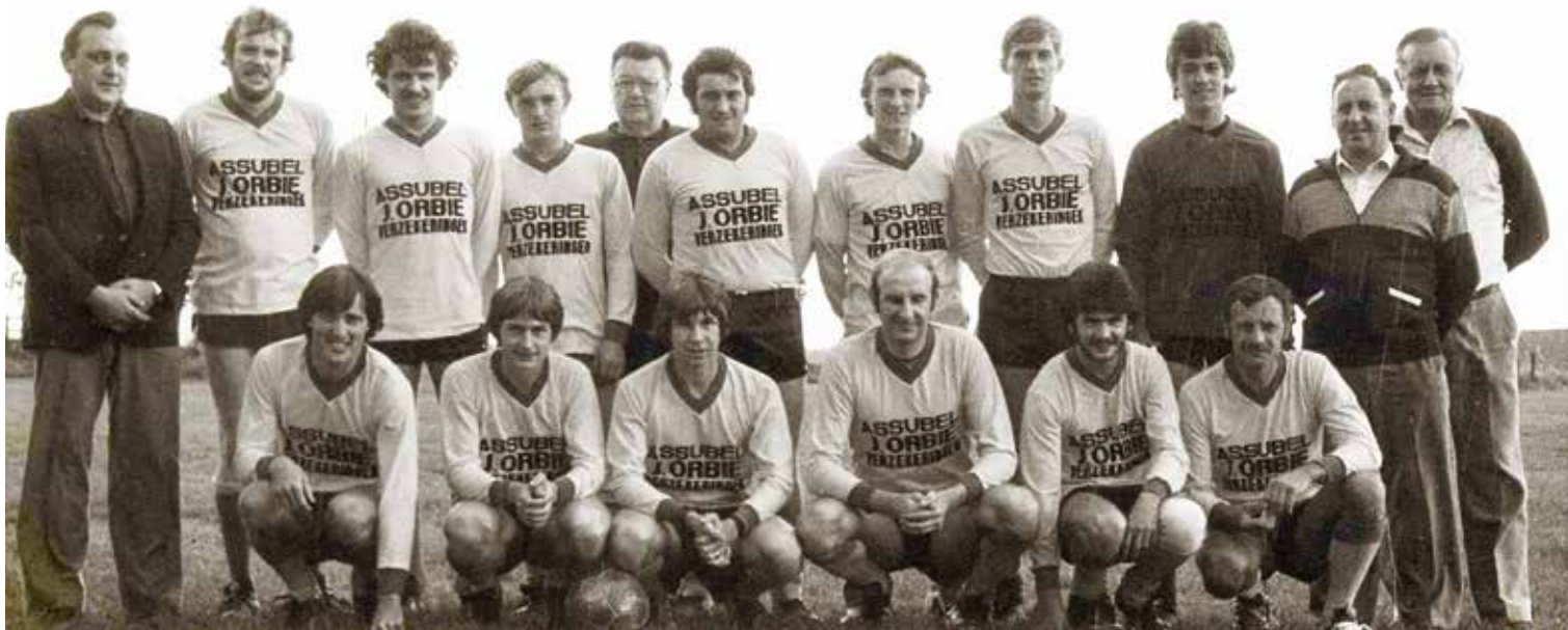
De eerste ploeg van Union Abele kreeg voor het seizoen 1981-1982 nieuwe truitjes.