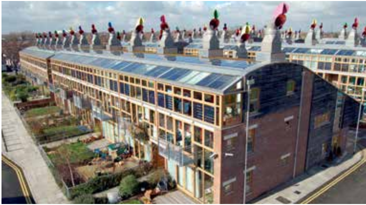
Bedzed project nabij Londen.