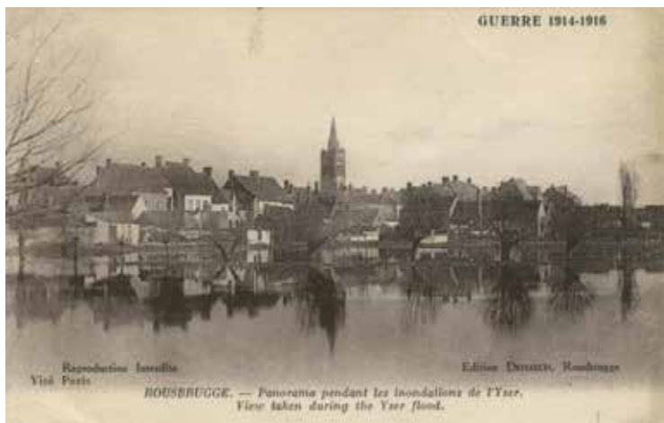
Zicht op Roesbrugge tijdens de overstromingen van de IJzer.

Intussen werden in ons land reeds op 29 juli drie militieklassen onder de wapens geroepen. Het was op woensdag 29 juli 1914 dat te Roesbrugge het bericht binnenkwam dat de militieklassen 1910, 1911 en 1912 hun legerkorpsen moesten vervoegen om de Duitse en Franse grens te gaan bewaken. Twee dagen later werden de klassen 1909, 1908, 1907, 1906, 1905, 1904, 1903 en 1902 opgeroepen. Op 4 augustus, de dag nadat ook Engeland de oorlog had verklaard, kwam bij het gemeentebestuur het bericht binnen dat ook de overige klassen: 1901, 1900 en 1899 gemobiliseerd werden.