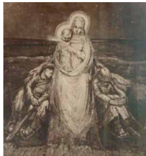
Onze Lieve Vrouw van den IJzer. (Joe English)

Deze moord gebeurde op de brug over de Miljacka te Serajewo. Om die reden verbrak Oostenrijk op 25 juli 1914 zijn diplomatieke betrekkingen met Servië dat dezelfde dag zijn troepen mobiliseerde. Dit was het begin van de eerste wereldoorlog, want drie dagen later verklaarde Oostenrijk de oorlog aan Servië. Rusland dat aan de kant van Servië stond, mobiliseerde hierop en de sneeuwbal was aan het rollen. Duitsland, solidair met Oostenrijk, verklaarde op 1 augustus 1914 de oorlog aan Rusland. Frankrijk steunde Rusland en mobiliseerde. Tijdens de nacht van 2 augustus ontving de Belgische regering de eis tot vrije doorgang voor de Duitse troepen om naar Frankrijk op te rukken. België verwierp de Duitse eis en bevestigde zijn neutrale positie. Nog diezelfde dag, 3 augustus, verklaarde Duitsland de oorlog aan Frankrijk. De dag daarop vielen de Duitsers België binnen. Wanneer de Duitsers weigerden zich uit België terug te trekken, verklaarde ook Engeland de oorlog aan Duitsland.