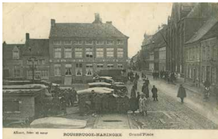
De markt enkele weken voordat die volledig zou worden overdekt.