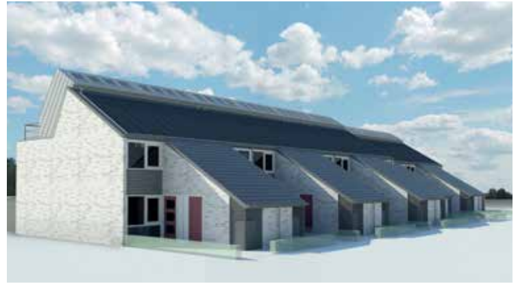
Tot activehouse gerenoveerde sociale woningen in Nederland.

4,5 in 2012. (51) Volgens sommige waarnemers is dit niet enkel het gevolg van een goed klimaatbeleid, maar ook van de liberalisering van de wereldhandel. Die maakte immers dat heel wat productie naar lagelonenlanden verhuisde. Dit vertaalt zich in het globale emissiecijfer dat in dezelfde periode steeg van 23 tot 35 miljard ton, met een Chinees giga-aandeel van 10 miljard ton. (52)