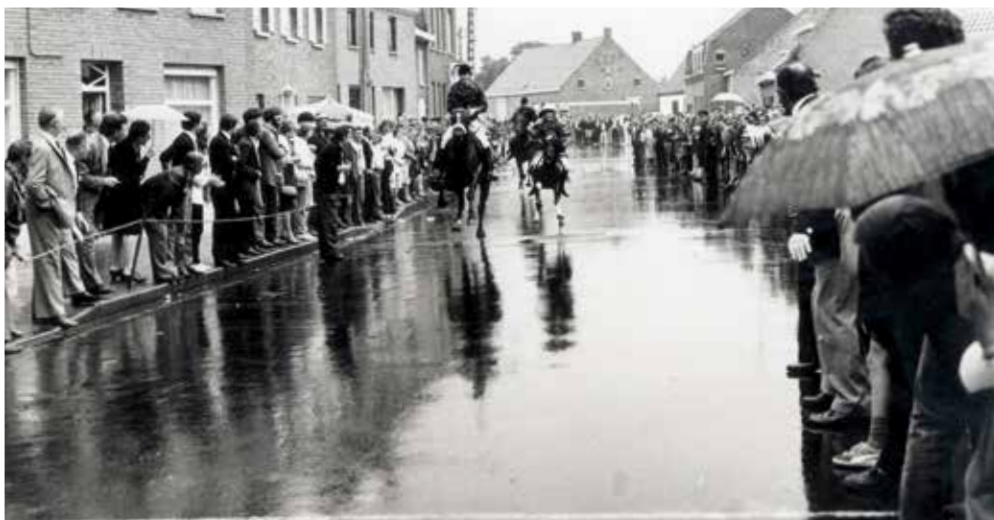
Straatpaardenkoers anno 1982 in Krombeke, in de regen en met een grote massa op post.

Wie dacht dat de tijd van geesten al lang voorbij was en eens meewarig glimlacht als een kleine voor het slapengaan nog snel even onder het bed kijkt of er geen spoken zitten, moet dringend die visie aanpassen. Want het grote fusiespook, dat in het verleden geregeld door ons land zweefde en niet zelden vreemde territoriale bokkensprongen maakte, is terug.