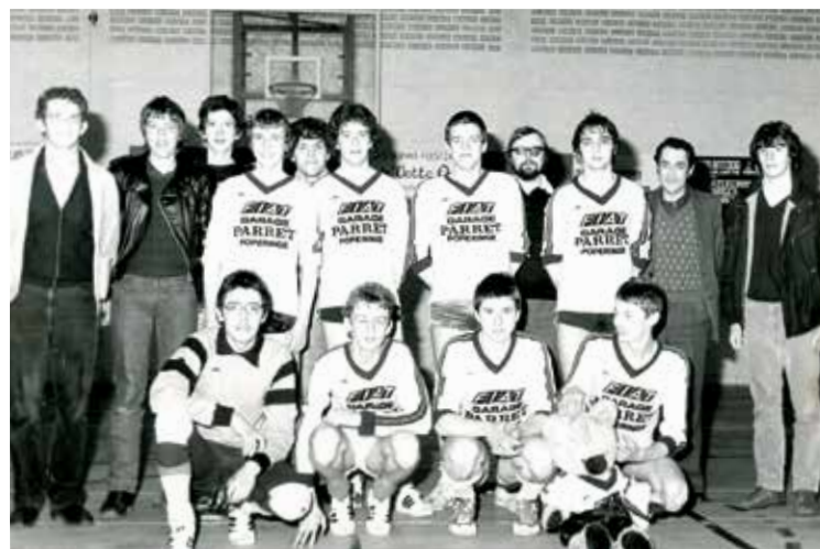
In 1982 wonnen de Hommelhofboys van Watou het zaalvoetbaltornooi in Dranouter. Ze mochten als beloning samen met de supporters in de krant.