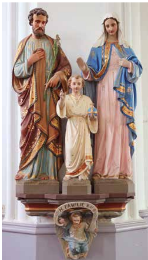
Beeld van de H. Familie