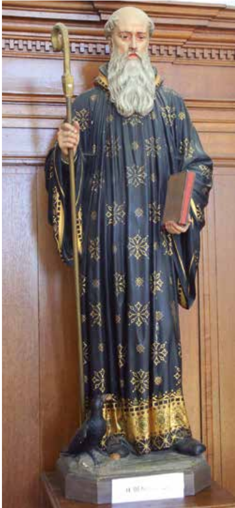
Beeld van de H. Benedictus