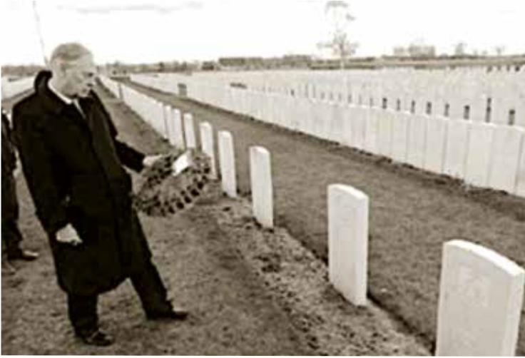
De auteur Lord Astor legt een krans op het graf van Esmond, Mendinghem Military Cemetery