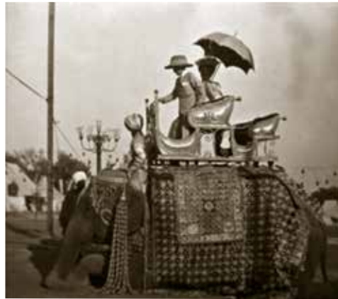
Esmond Elliot tijdens zijn verblijf in India

Zijn vermogen om te communiceren en vertrouwen te wekken hielp hem enorm toen hij bij het leger ging.