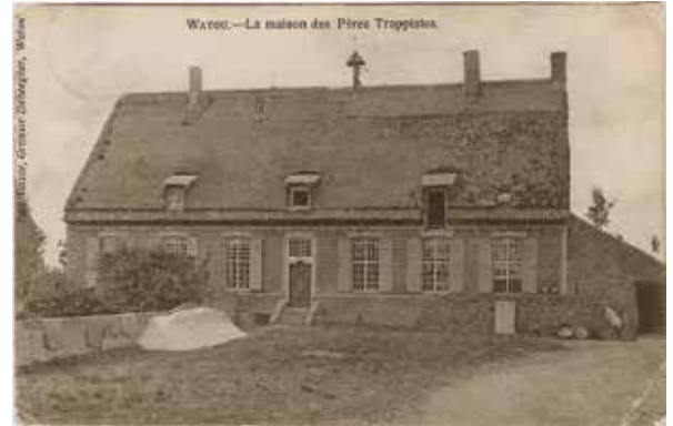
Refuge St.-Bernard van de paters trappisten