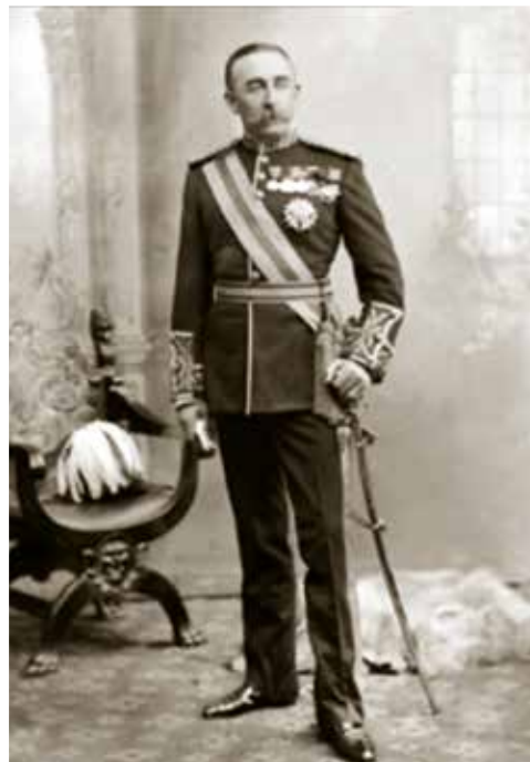
Esmonds vader, Gilbert John Elliot-Murray-Kynynmound

Gilbert John Elliot-Murray-Kynynmound, 4e graaf van Minto, voluit Gilbert John Elliot-Murray-Kynynmound, 4e graaf van Minto, burggraaf Melgund van Melgund, Baron Minto van Minto, (geboren op 9 juli 1845, Londen - overleden op 1 maart, 1914, Minto, Roxburgh, Scot.), Gouverneur-generaal van Canada (1898-1905) en onderkoning van India (1905-10). In India sponsorde hij en zijn collega John Morley de Morley-Minto Reforms Act (1909). De wet verhoogde de Indiase vertegenwoordiging in de regering enigszins, maar werd bekritiseerd door Indiase nationalistenvanwege de oprichting van afzonderlijke kiezers voor hindoes en moslims, die volgens hen verdeeldheid onder de Indiase bevolking bevorderden om de Britse overheersing te vergemakkelijken. Opgeleid aan Eton College en Trinity College, Cambridge, diende Minto in de Scots Guards (1867-1869), vertrok voor een korte carrière in de ruitersport en was daarna krantencorrespondent in Spanje en Turkije (1874-77). Hij nam deel aan de Tweede Afghaanse Oorlog (1879) en aan de Egyptische campagne (1882) voordat hij in 1883 naar Canada ging als militair secretaris. In 1886 keerde hij terug naar Engeland, waar hij in 1891 de titels en graafschap van zijn vader opvolgde. In 1898 werd hij benoemd tot gouverneur-generaal van Canada en leidde hij de conflicten tussen de Canadese premier Sir Wilfrid Laurier en de Britse koloniale secretaris Joseph Chamberlain. In 1905 werd Minto benoemd tot onderkoning van India, met John Morley als staatssecretaris.