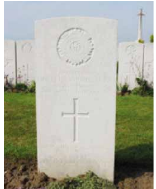
Gedenksteen in Mendinghem Military Cemetery

Zijn vader, de 4e graaf van Minto, mijn overgrootvader van mijn vaders kant van de familie, was aan het begin van de vorige eeuw achtereenvolgens gouverneur-generaal van Canada en onderkoning van India. Door Kitchener beschreven als 'de beste, meest dappere en bewaamste bestuurder die Groot-Brittannië ooit heeft voortgebracht', dwong hij door zijn warmte, tact en zachte humor een aanhang onder degenen die onder hem dienden. Met