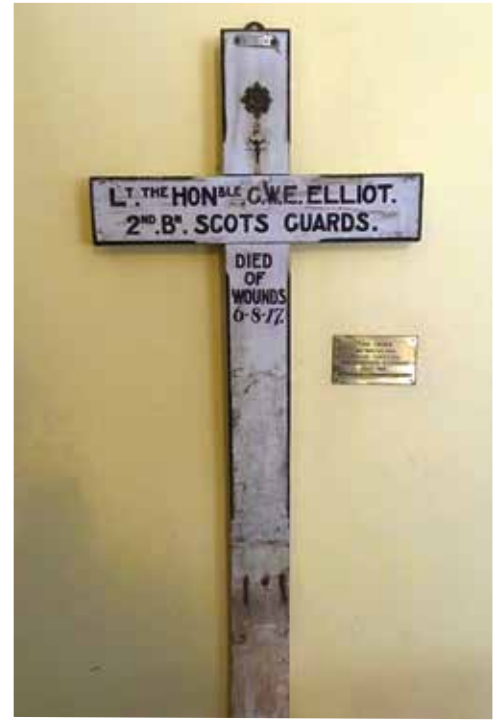
Het kruis van Proven

De twee mannen waren het erover eens dat bepaalde politieke hervormingen nodig waren om goed opgeleide Indiërs tevreden te stellen, om gematigde leiders van de Indian National Congress Party te versterken en om het toenemende nationalisme te beheersen. Bijgevolg werden twee Indiase leden benoemd in de raad van de minister van Buitenlandse Zaken en één in de uitvoerende raad van de onderkoning. De wens van Minto om een betere vertegenwoordiging van de landbelangen en commerciële belangen voor moslims in de wetgevende raden te verzekeren, resulteerde in de oprichting van afzonderlijke hindoeïstische en islamitische kiezers. Hij moedigde ook de oprichting van de Muslim League als een rivaliserende organisatie voor het congres. Zijn critici zagen dit als onderdeel van een "verdeel en heers"-beleid dat de schuld kreeg van de uiteindelijke opdeling van India. Minto heeft de macht van de regering om zonder proces te deporteren nieuw leven ingeblazen om de revolutionairen Lajpat Rai en Ajit Singh aan te pakken, en hij stelde strenge maatregelen in tegen degenen die voorstander waren van gewapend verzet tegen de Britse overheersing.