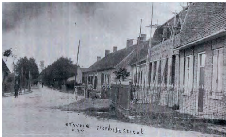
Zichtkaart ca. 1897 - Rechts het café van Jules Kockenpoo, achter het boompje in het midden café "het Boerenhol" en op het einde van de rij huizen café "Op de hoek".

26. Op de hoek , nu Krombekerstraat 73 - bij Prosper Looten