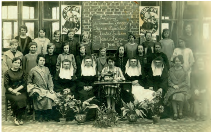
Singer-naaimachine op promotour in de meisjesschool in 1928.