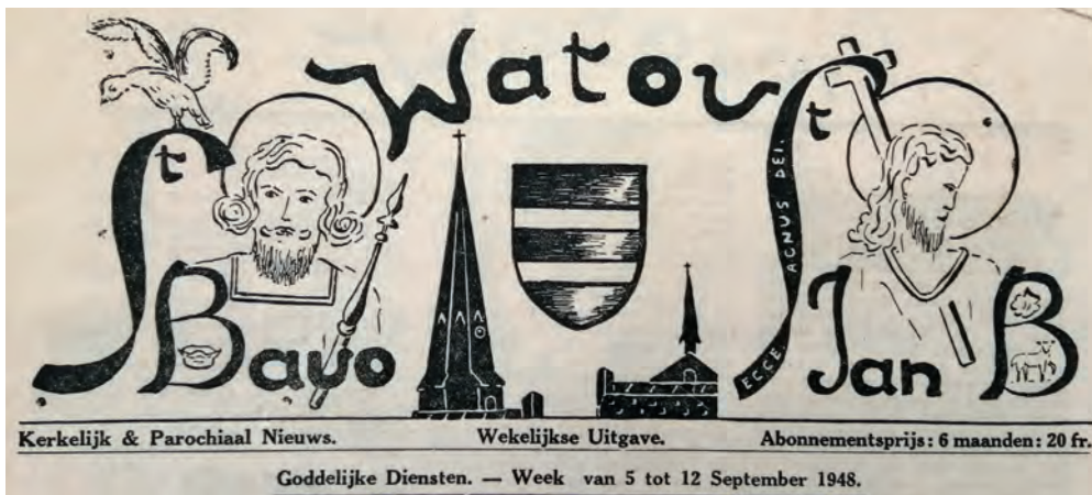
Hoofding van het parochieblad van september 1948.