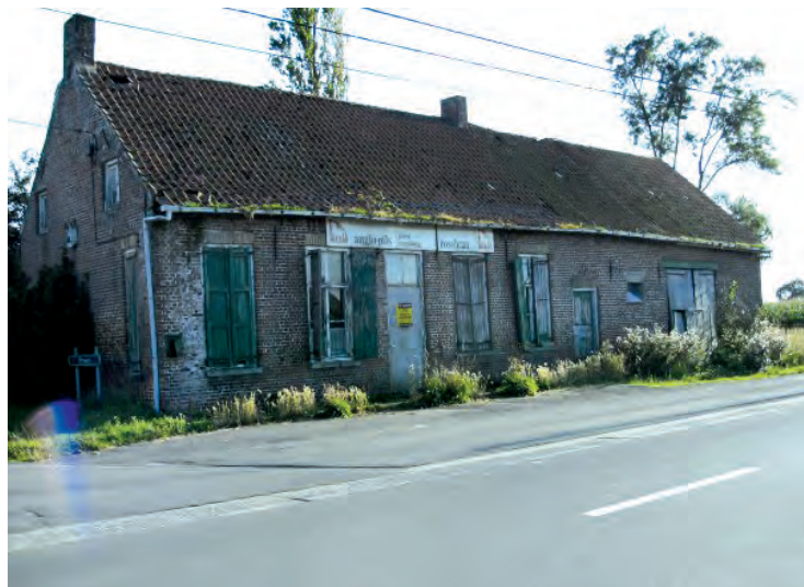
café "Den Hoogen Waeyenburg".